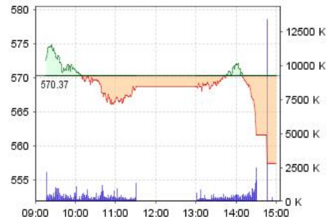
VN-Index: Kết quả giao dịch